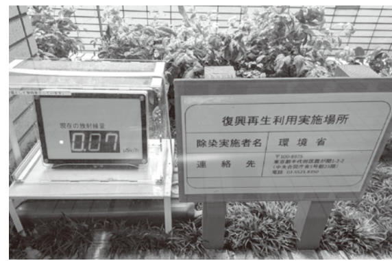
環境省が入る合同庁舎5号館の花壇に、復興再生土を利用。訪問時の放射線量は0.07μSv/時を示していた。国際的な安全目標の0.23μSv/時と比べても十分に低い。

経て策定された基準に基づき、首相官邸や霞が関の庁舎敷地内で実際に復興再生土を用いた花壇などの造成を行い、モニタリングを続けています