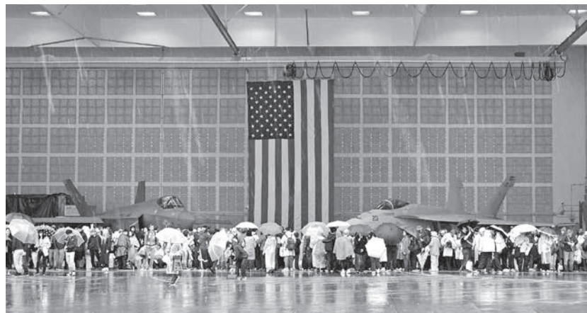
格納庫には海軍型F-35CとF/A-18スーパーホーネットが並んで展示された

常的な騒音や事故のリスクも辛抱強く我慢を強めてきていて、特筆すべきは、騒音や事故の危険性を抑えながら、地域との共存共栄を図るために、滑走路の沖合への移設を貫徹したという決断と実績があることだ。