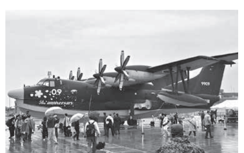
日本が誇る海上自衛隊の救難飛行艇US-2

山口県東部に位置し、瀬戸内海を望む錦川の三角州上に広がり、日米共同で運用。米軍は、第1海兵航空団（司令部は沖縄）の約半数と第3海兵兵站群の分隊、海軍の第5空母航空団が駐留。海上自衛隊は第31航空群などが駐留。基地人口は約一万三千人にのぼる。 岩国市は石油化学や製紙業を主軸とする瀬戸内工業地帯の一翼を担う一方、基地駐留のアメリカーナもたらす国際色豊かな側面も併せ持つ。特筆すべきは、基地と地域社会の共生に向けた歩み。平成九年から開始された滑走路沖合移設事業では、騒音の軽減と安全確保を目的に、愛宕山の土砂で瀬戸内海を埋め立て、滑走路を一キロ沖合へ移設した。平成二十二年に完成した新滑走路は、同二十四年の岩国錦帯橋空港の開港にも繋がり、軍民共用の空の玄関口ともなっている。 基地との「共存共栄」を図ってきた岩国市民の深い理解と、日米一体の高度な統合運用体制で、今や極東における抑止力の要衝となっている。