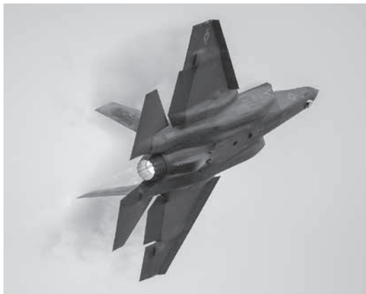
米海軍型F-35Cがアフターバーナーを全開して急上昇

今年の目玉は、米海軍の最新鋭ステルス戦闘機「F-35C ライトニングII」デモチームの初参加だ。米本土以外での機動飛行(デモフライト)は岩国が初めて。空母艦載型特有の大きな翼で、重力をもとめせず上昇する勇姿は、米空母「ジョージ・ワシントン」の再展開に伴う極東