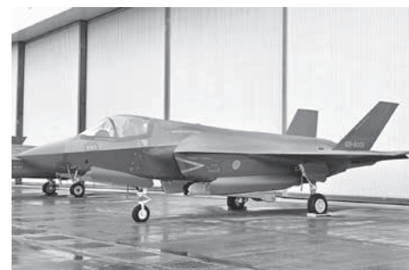
航空自衛隊のF-35Bも初展示された