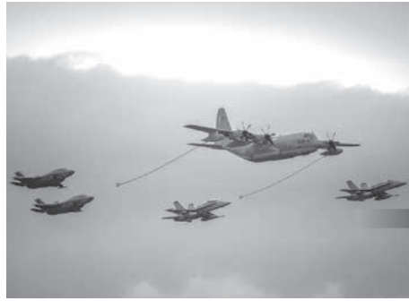
米海兵隊機による空中給油のデモ飛行