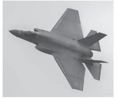
米海軍艦載機の主力となってきたF-35C