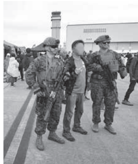
肩を並べて海兵隊員と記念撮影