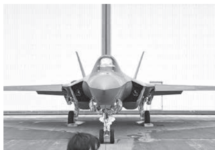
大きな主翼が特徴の海軍型F-35-C