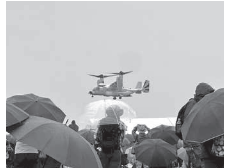
低空で飛行する米海軍オスプレイCMV-22B