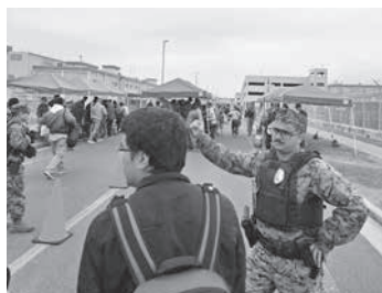
警備と親善が同居

緊迫する中東情勢を受け、在日米軍基地での行事中止が相次ぐ中、米軍岩国基地は「日米フレンドシップデー2026」を敢行した。この決断は、単なる恒例行事の維持を超え、極東における岩国の戦略的価値を内外に示すものでもあった。行事実施の背景には冷徹な意図がうかがえる。何より、中国やロシ