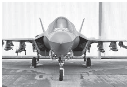
垂直着陸が可能な米海兵隊F-35B