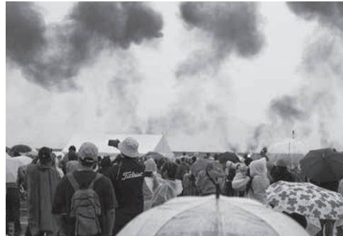
地上支援攻撃のデモ飛行では大音響と共に火炎も