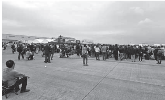
雨の中、4万5千人が来場した