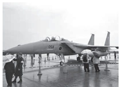
航空自衛隊の主力級F-15戦闘機