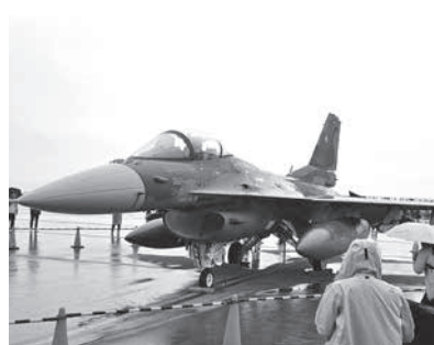
日米共同開発されたF-2戦闘機