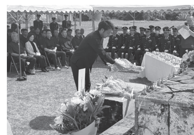
参列者全員で献花

戦後八十一年。激戦の地となった沖縄本島、激しい空爆や艦砲射撃を受けた八重山諸島を巡る安全保障環境は厳しさを増している。参列者の一人は「今こうして私たちが平和を享