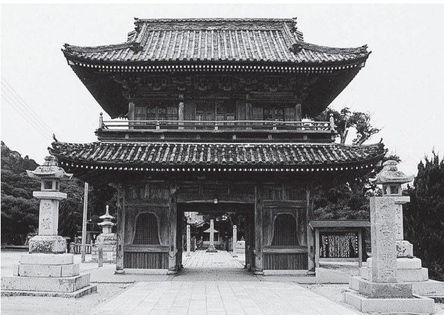
普賢寺山門には国宝級の十六羅漢像、境内には平康頼の歌碑、雪舟の庭等、見るべきものが多い。尚、開基性空上人の入寂の日をとって定めたという毎年五月十三日、十四日、十五日の三日間の普賢祭には、盛大な農具市や露店市がたち、古くから普賢市として知られている。

尚、開基性空上人の入寂の日をとって定めたという毎年五月十三日、十四日、十五日の三日間の普賢祭には、盛大な農具市や露店市がたち、古くから普賢市として知られている。