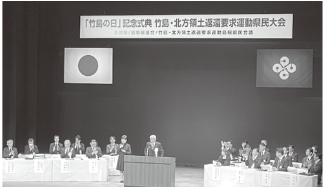
竹島の領土権の早期確立を求める特別決議を採択

わが国固有の領土であること、不法占拠を決して容認すべきでないこと、毅然とした態度を取りつ