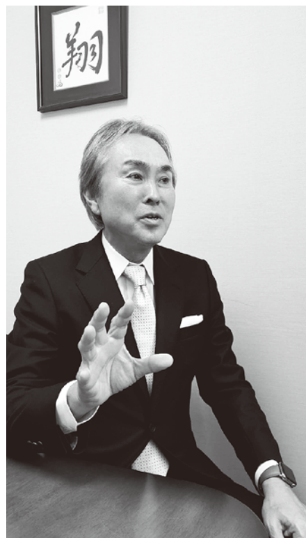
石原 伸晃 (いしはら・のぶてる) 氏

昭和32年4月19日生まれ。慶應義塾大学卒。日本テレビ政治部記者として大蔵省・外務省・首相官邸等を担当。退社後、平成2年に衆議院議員に初当選。以来東京8区(杉並区)より10期連続当選。平成13年、小泉内閣の行政改革・規制改革担当大臣として初入閣。以来、閣僚としては、国土交通大臣、初代・観光立国担当大臣、環境大臣・原子力防災担当特命大臣、経済再生担当大臣などを歴任。衆議院の法務委員長、自民党では政務調査会長、幹事長を務めた。現在、自由民主党東京都支部連合会最高顧問。