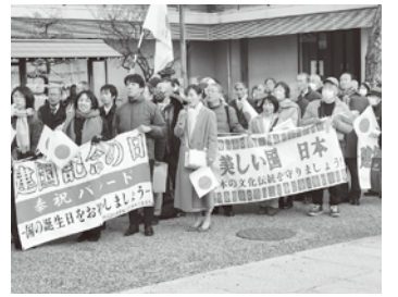
横断幕を先頭にパレード(神戸市)

松山市では、建国記念の日奉祝愛媛県中央大会が愛媛県民文化会館サブホールで開催され、三百人の市民が建国記念の日を祝った。式典では、国歌斉唱、檀原神宮遥拝、紀元節の歌斉唱などに続き、元航空自衛隊空将の織田邦男氏による「日本を守るための提言」と題する講演会が行われた。