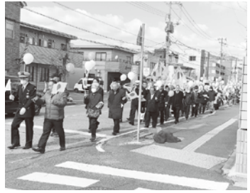
国旗と風船を手にパレード(岩国市)

の皇紀二六八五年は昭和で言えばちょうど百年。戦後から八十年。阪神淡路大震災から三十年、日航機が御巣鷹山に墜落し五百二十人の方が亡くなって四十年の節目の年。八紘一宇の精神のもと、日本人としての誇りと道徳心を大事にしていこう」と述べた。この後、市民憲章の唱和、岩国市歌と紀元節の歌の合唱、万歳三唱を行い、パレードに移った。