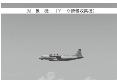
多くのアンテナを持つスパイ機(防衛省)

中国軍のスパイ機が、八月二十六日に長崎県の男女群島の領空を侵犯した。最近ではわが国の領空周辺を飛行する中国軍機が増加し、航空自衛隊の戦闘機の緊急発進(スクランブル)が増えている中で、初めての領空侵犯だ。政府は、「わが国