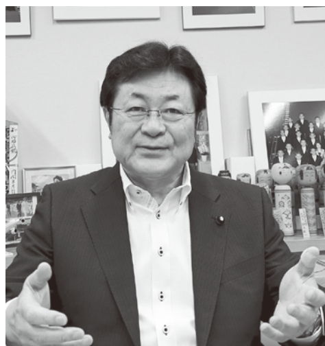
西村 明宏 (にしむら・あきひろ) 氏

昭和35年生まれ。早稲田大学政治経済学部政治学科卒、同大学院政治学専攻科修了。大蔵大臣秘書官、早稲田大学講師、東北福祉大学教授を務め、平成15年の衆議院議員総選挙に宮城3区から出馬初当選。現在、6期目。内閣府大臣政務官、国土交通副大臣・復興副大臣、内閣府副大臣、内閣官房副長官などを歴任し、令和4年に環境大臣・内閣府特命担当大臣として初入閣。現在、自由民主党国会対策委員長代行。