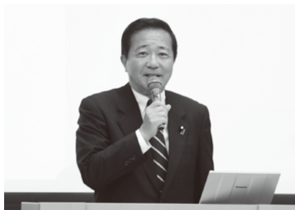
自由民主党・衆議院議員 長島 昭久 (ながしま・あきひさ) 氏

昭和37年(1962)2月生まれ。慶應義塾大学法学部(法律学科、政治学科)卒業、同大学院(憲法学)修了。衆議院議員石原伸晃氏の公設秘書、東京財団主任研究員、米国外交問題評議会 上席研究員を経て、平成15年(2003)衆議院議員に初当選。防衛副大臣(2012)、衆議院安全保障委員会委員長(2021)など歴任。現在、自由民主党政務調査会副会長並びに自由民主党国際局長代理。東京30区(府中市・多摩市・稲城市)。