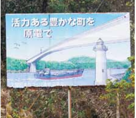
上関町の入り口に長年掲げられている原電推進の看板

「これまで原子力を争点にした町長選・議会議員選挙で十回すべて推進側が勝利し続けてきている事実も重いと思うが。一昨年の町長選挙を「原子力を争点にする」最後の選挙にしてもらいたいと思っている。昭和五十七年当時の町長が原子力誘致を表明して二十八年目の平成二十一年に準備工事が始まったが、直後の東日本大震災でまったく動かなくなり、住民にとっては原子力の言葉すら遠い存在になりつつあった。そんな中で一昨年の町長選では「原子力が争点」となり、過去最高となる七〇・四％の得票率を得た。これは、住民の最後の意思表示だと思ふ。この四年間で、新增設について、きちんと明確な指針を国には提示してもらいたいし、町長としても何としても上関町の方向性を確立する責務があると思う。」