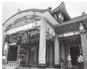
神社様式の紅毛港保安堂

しての気概が伝わってき「台湾永遠的朋友」(台湾にとつての永遠の友)とあり、銅像横には「台湾加油」(台湾、頑張れ)の安倍元総理直筆の書を刻んだ石碑が建立され、背景には富士山の写真が掲げられていた。