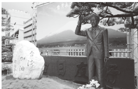
等身大の安倍元総理の銅像

桃園からは新幹線で約二時間、終点の左營駅で降りて、車で約二十分の街中に保安堂があった。海の近くとばかり思っていたので意外だった。元々は紅毛港という漁村にあったが、高雄港一帯の再開発で、集落全体が移転となり、保安堂も内陸部に移ったとのこと。敷地近くになると、台湾