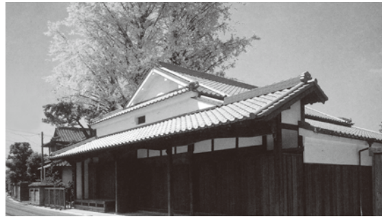
福岡県指定有形文化財（建造物） 北九州市指定文化財（史跡）

「ボジティブ心理学」からも幸せの要素として示された指標もあります。ウェルビーイングを取り入れた経営の利点として、生産性の向上、人材の確保が挙げられます。従業員が心身ともに健康になり、上司などの人間関係も円滑であれば意欲的に働くことができ、生産性や成績の向上につながることが明らかにな