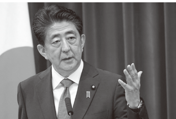
常に日本を背負い憲法改正を強く訴えた安倍元総理

風評被害の解消が大きな課題となっているが、『原発』と呼ぶ限りは、『原爆』『原発』で、無条件に放射能を怖がるという状況を打破することはできない。風評被害対策としても、国会議員や政府関係者は『原電』と呼ぶのを止めて『原電』と呼称すべきである。