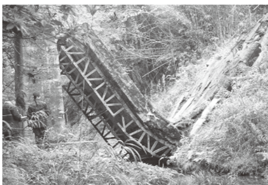
老朽化で崩壊した道路橋

平成二十四年の笹子トンネル天井板崩落事故では、老朽化が原因でコンクリート板が約百三十メートルにわたり落下した。走行中の複数台の車両が巻き込まれて、国内の高速道路での事故としては過去最大の九人が亡くなる痛ましい事故となった。この事故後、