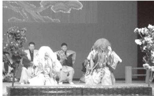
日本の伝統文化である「能」が奉納される(北九州市)

第一部の奉祝式典で、国歌斉唱、主催者式辞、来賓祝辞などが行われた後、第二部では、能楽鑑賞が催されました。北九州市民による舞囃子「高砂」、観世流の能の「石橋」が披露され、参加者は日本の伝統文化を堪能しました。