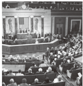
米議会で演説する安倍総理

安倍晋三前総理大臣は、米国が国際的な役割を縮小する中で、自由、民主などの普遍的価値に基づくルールを重視する国際秩序を守るという戦略を鮮明にし、わが国の国際的役割を拡大してきた。インド太平洋地域の秩序形成を主導し、EUとの安全保障関係を強化するなど、日本外交の質的大転換を果した功績は実に大きい。新内閣は、わが国の平和と繁栄のために、安倍外交・安全保障戦略を継承し、さらに発展させなければならない。