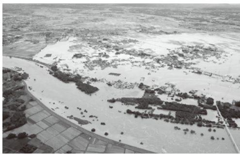
氾濫した鬼怒川

水害から住民の命を守るためには、住民が避難するための情報が不可欠だ。避難の必要性を判断する情報としては、国や都道府県が出す「大雨特別情報」「氾濫危険情報」といった防災気象情報と、市町村が出す「避難勧告」「避難指示」