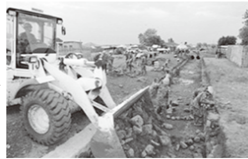
スーダンでのPKO活動

さらに中国は、米国の安全保障会議などの設置を目指した。さらには日米同盟による二国間だけの枠組みから、国際協調主義に基づく多国間の安全保障外交を展開した。