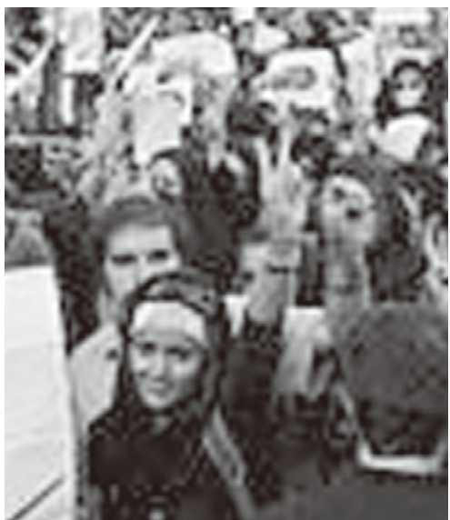
ピースサインの画像からも指紋情報が取れる

ックトックの禁止の動きを受けて、多くの自治体はとまどっており今後の提携の行方が注目される。いずれにしても、自治体や企業がティックトックなどSNSを利用して広報活動をする場合は、自治体や企業と利用者がインターネット上でつながるため、住民の個人情報、企業の機密情報などが漏洩するおそれが高まる。あるいは、誤情報やデマ、権利侵害、不適切な発言などにより、住民や顧客に迷惑を掛けたり、逆に自治体や企業が被害を受けるリスクもある。