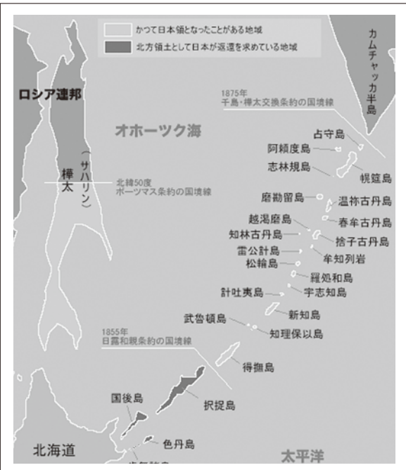
1875年の「樺太・千島交換条約」で千島列島が日本領となった。

二十二日の占守島と幌筵島の武装解除に続いて、ソ連軍は南下を続け、千島列島の日本軍を武装解除して