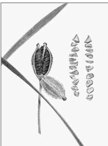
蒴果30ミリ 種子5~7ミリ

っているというのです。その自生地の花菖蒲は、紫色の花被の広いものや、白地に紫色の筋の入ったもの、桃色に近い花まで多様な色彩が見られます。私は最初からノハナショウブの自生地として見ているため、まさか園芸種の血が入っているなんて思いもしなかったのですが、専門家が見ると一目瞭然であり、「浸透」が起きていることがわかります。そこはもともと民有地で、花菖蒲を鑑賞するために屋根つきの縁台が設けられていることから、昔ノハナショウブとともに園芸種の花菖蒲を植えて鑑賞していたのでしょう。たや