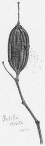
蒴果30×12ミリ・種子1ミリ

もっとも進化した蘭類でも、そのみで生きていくことは不可能で、他の植物や菌、昆虫がいるからこそ