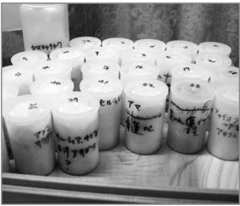
種子コレクション (一部)

種子の形態は種子植物の数ほど存在します。二十万種類とも言われる数の種子がこの地球上に存在するのは、適応が作りだした自然の造形に感動し、種子の拡大図を描きながら、なぜこういう形をしているのか、