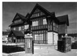
旧門司三井倶楽部

明治の後半から横浜、神戸と並ぶ国際貿易港として栄えた門司港は、今も当時の面影を残すレトロな建物が数多く立ち並ぶ。歴史とロマンがあふれる市内屈指の観光スポット