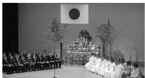
下関ではステージに拝殿を造り建国を祝った

防府市では、防府天満宮から天神ピアまでのアーケード街を各自が手旗国旗を持ち、小雪がちらつく中、行進しました。行進の後、天神ピアにて奉祝式典が執り行われました。