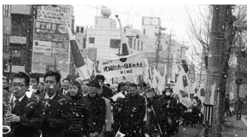
国旗を手に雪の中を行進する山口市民

山口市では、雪が舞う寒空の中、亀山ふれあい公園から道場門前の商店街を通り、山口市民館までの約二キロの道のりで、奉祝パレードが行われました。参加者は各自が国旗を持ち、自衛隊のブラスバンドの演奏に合わせ、行進しました。パレードの後、山口市民館にて、山口市建国記念の日奉祝大会式典が営まれました。国歌斉唱の後、奉祝大会式辞、来賓祝辞などが行われました。式辞では、主宰者代表が「建国記念の日を契機に私たち国民一人ひとりが国家への感謝と奉仕の念を育んでいきましよう」と述べました。