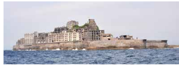
軍艦島の全景・荒廃した建物の保存は大きな課題

軍艦島は、長崎半島から約四・五キロ離れ、長崎港から南西の海上約十七・五キロの位置にある。本来は、南北約三百二十メートル、東西約百二十メートルの小さな瀬だった。一八一〇(文化七)年頃に石炭が発見されたが、江戸時代の漁業が終わり頃まで、付近の漁民が漁業の傍ら「磯掘り」と言われる、露出している石炭の小規模な採取をしていたと言われている。