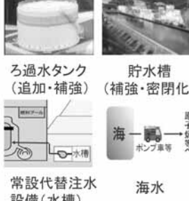
新たに追加・強化した手段