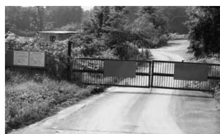
隣家もない山間部で大規模造成

子をほとんど見ることができない。掲示されている看板を確認すると、新たに七十三ヘクタールの森林に宅地を造成する計画があることが判明した。