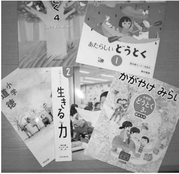
平成30年度から使用される「特別の教科 道徳」の教科書

平成三十年四月から、いよいよ小学校で『特別の教科 道徳』が始まる。使用される道徳の教科書は、東京書籍や学校図書、日本図書出版など、八社の教科書が検定で合格しており、八月中に全国の市町村教育委員会で、道徳の教科書の採択が行われた。