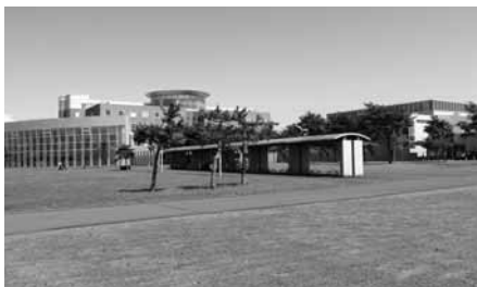
広大な土地に点在する校舎

「学校法人京都育英館」は無償で移管譲渡されることになっている。京都育英館は、平成二十五年四月に設立され、京都看護大学や苦駒小牧市に隣接する白老町で北海道栄高校を買収して運営している。京都育英館を設立した「学校法人育英館」は、京都ピアノ技術専門学校や関西言語学院（京都市）、四万十看護学院（高知県四万十市）を運営し、さらに中国・瀋陽市では、東北育才外国語学校を経営している。