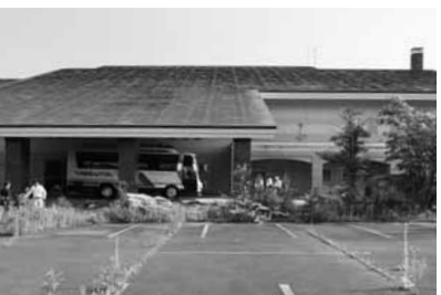
クラブハウスも放置されたまま

伊達市内の山林内にあるゴルフ場「トーヤレイクヒルゴルフ倶楽部」跡地は、平成二十二年に中国資本が買収したが、ほぼ手つかず