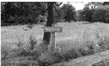
コースも手入れがされていない

状態で放置されている。クラブハウスは閉ざされたままで、廃墟のようだったが給油施設は稼働していた。中国人の出入りがあるのは間違いないさうだ。