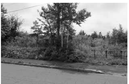
向かい側の土地には千棟の計画があった

最初の目的地は、新千歳空港に近い千歳市内の中国人専用別荘地だ。別荘地は高台にあり、航空自衛隊千歳基地が一望できる。基地まで直線距離で約五キロしかない。安全保障上、極めて重要な場所だ。ここに、中国人名の表札がかかっている住宅十七棟（敷地面積約六千五百平方メートル）が建っている。家具・インテリア大手の「ニトリホールディングス」の完成し、即完売した。