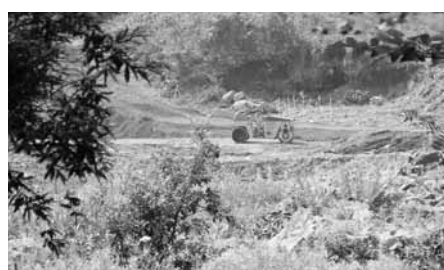
中の工事の様子は垣間見えるだけ

登録市上登別町にある中国風テーマパークの跡地七ヘクタールが中国資本に買収されている。来年の稼働を目指し、太陽光パネルの設置を進めているというが、周囲が森林で、通行量も少なく、外からは中の様子