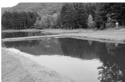
芝生も手入れされ釣り堀にも水が注がれていた

入口の看板には「アカイガワ・トモ ゲストハウス」と記載され、のぼり旗には「Opening soon」となっていた。そこでホームページから申し込みをした。「予約を受け付けました」とメールによる返事があったものの、数日後には「予約キャンセル、確からからキャンセルしたかのようメールが来た。しかも申し込みの人数も違っていた。ホームページには、依然として「Opening soon」となっているが、予約の申し込みができません。何のために営業しているように装っているのであろうか。