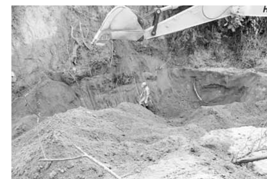
重機で広範囲に捜したが見つからなかった

山々が連なる山岳地帯になるも舗装もされていない道が続く、ガタガタと揺られながら、十五〜六時間かけてようやく到着しました。日本兵は、食糧や武器、弾薬などの重装備で、この道を歩いて進軍したのだから、本当に大変だったろう