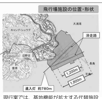
現行案では、基地機能が拡大する代替施設

しかし、政府の説明は透明性を欠き、不十分だ。軍隊アレルギーを持つ国民、とりわけ沖縄県民への説明が容易でないのは理解できる。しかし、基地の規模や機能を小さく見せかけるために数字を粉飾し、事実を隠蔽する姿勢が政府不信を高めている。もちろん、政府の不誠実な姿勢には、野党や国民の側にも責任はあ