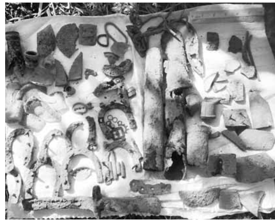
(上) 今回の調査で収容した戦死者の遺骨 (下) 日本軍の遺留品も次々と見つかった

戦死者遺骨収集推進法が昨年四月に施行され、遺骨収集の実務が厚生労働省から一般社団法人日本戦死者遺骨収集推進協会(以下、推進協会)に移り、昨年十月から業務を開始し、各地に調査員が派遣された。約四万五千六百柱が未収容となつて