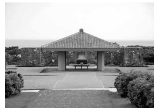
摩文仁の丘の『国立沖縄戦没者墓苑』

六月二十三日の「慰霊の日」の朝は、毎年、沖縄県は静寂に包まれる。摩文仁の丘の「国立沖縄戦没者墓苑」では朝早くから県民が手を合わせて慰霊する姿が見られる。沖縄戦などで亡くなられた二十万人余りの人々の氏名を刻んだ「平和の礎」をはじめ、各都道府県の戦没者慰霊塔などは、『慰霊の日』の数日前から多くのの人々によって清掃され、参拝する人々を迎える。こうした平和を求める人々の願いとは逆に、国際情勢は緊張を高め、沖縄の過重負担を減らす基地の削減もなかなか進まない。