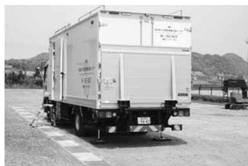
放射線被曝を防ぐコントロール車

遠隔操作機材が充実。施設の様子や資機材について具体的に教えてください。遠隔操作機材が充実。施設の様子や資機材について具体的に教えてください。