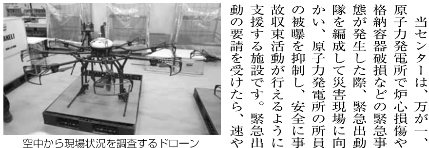
空中から現場状況を調査するドローン

当センターは、万が一、原子力発電所で炉心損傷や格納容器破損などの緊急事態が発生した際、緊急出動隊を編成して災害現場に向かい、原子力発電所の所員の被曝を抑制し、安全に事故収束活動が行えるように支援する施設です。緊急出動の要請を受けたら、速や