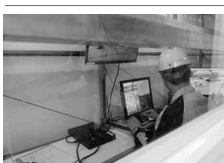
モニター映像のみを頼りに遠隔操作

当センターの所員は全員で二十一人です。夜間や休祝日には、二人が宿泊施設に常時待機し、残りの十九人のほとんどは教習市内に住んでいます。これらの者にも交代制で四人に対して拘束をかけています。緊急連絡が入れば、拘束をかけている四人がすぐに駆け付ける体制にしています。資機材の輸送は、基本的