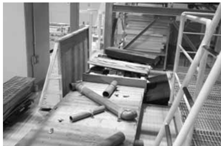
瓦礫の散乱を想定した訓練施設

遠隔操作ロボットの操作訓練は、実際に瓦礫を散乱させたコース上を走らせる訓練を行っています。このほか、液体溜りのサンプリングをする訓練もできるようになっています。また、真つ暗な現場での作業を想定し、訓練施設全体を暗室にし、ロボットの明かりだけで訓練することもできるようになっています。暗闇の中でバルブを回したり、電源盤の蓋を開けるなどの細かい作業の操作訓練もできます。