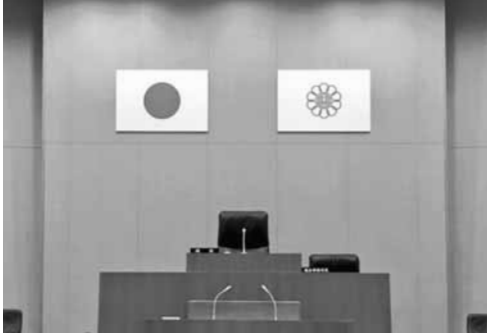
越谷市議会本会議場に国旗と市旗を掲揚

埼玉県内では、平成二十五年四月に弊社が独自で調査した時点で、四十ある市議会のうち、十一市議会しか国旗が掲揚されていない。その後、平成二十七年八月までに、飯能市、本庄市、東松山市、春日部市、上尾市、北本市、坂戸市で国旗が掲揚され、十八市議会に増えていた。そしてこの度、