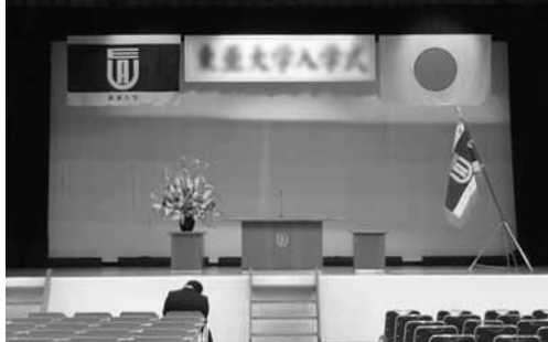
左右逆に掲げられた国旗

一般的には、式典などで国旗や市旗、校旗などを掲げる場合、国際儀礼に準じて掲げる。これによると、基本は国旗と市