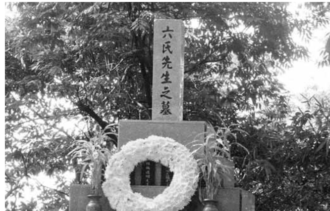
台湾の台北市士林にある芝山巖の「六氏先生之墓」

また、侍、日本刀、剣道といった日本文化は「韓国が起源だ」と主張する団体もある。韓国が不法占拠している竹島については、竹島の日に島根県で式典が行われれば、韓国内外で過激なデモを催すなど、反日行動はやりたい放題である。こうした風潮が韓国国内にある限り、韓国民の日本人への憎悪は暴発しかねない。傍若無人な日本人修学旅行生が、いつどこで、憎悪の牙の対象となるかもしれない危険性がある。