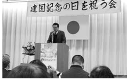
台湾での日本人の功績を紹介する季氏の講演

岡山県岡山市では、岡山護国神社に二百人の市民が集まり、建国記念の日を祝いました。式典では、国歌斉唱や式辞に続き、大会決議が行われ、「麗しき国柄を次代へ伝えてゆくべく、如何なる非常事態に直面しても、独立国家として他国の不当な圧力に屈することなく、主権を守る確固たる