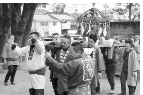
神輿渡御で建国記念の日を祝う

熊本県人吉市では、国宝の青井阿蘇神社を会場に、第五十一回建国記念の日奉祝行事が行われました。式典には百十人の市民が参加し、奉祝詩吟、奉祝神輿渡御などが行われました。大会決議では、「自国の防衛を他国に大きく依存し、とかく内向きの議論に終始してきたこれまでの情弱な姿勢に断固として決別し、真の自立を確かなものとする」とともに、世界に調和と共に