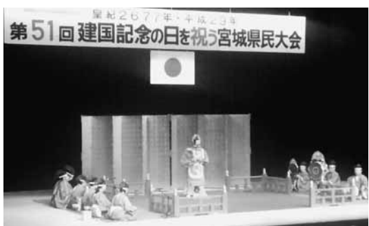
宮城野音楽会の奉祝演奏