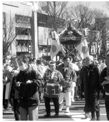
表参道で合流した神輿隊

東京では、晴天の中、神宮外苑銀杏並木通りから表参道を通り明治神宮の大前まで、総勢六千人の奉祝パレードが行われました。首都圏の大学のマーチングバ