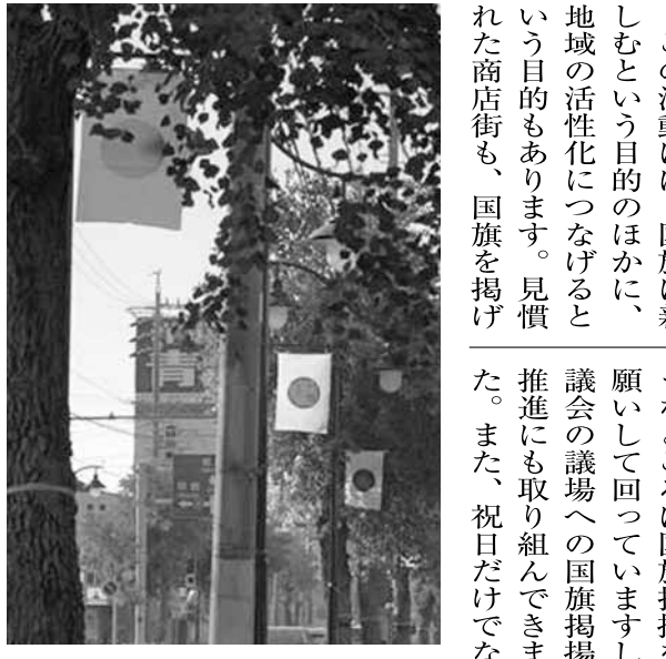
街灯にも国旗を掲揚

「国旗掲揚推進愛知の会」とは、どのようなグループですか。私たちの活動は、平成二十一年、愛知県岡崎市から始まりました。今ではあまり見かけなくなつてしまつた「祝日の国旗掲揚」ですが、かつては当たり前のように日本中で行われていました。祝日に国旗を出して、お祝いは、祝日です。祝日は、宮中行事や地域の年中行事と深いつながりがあります。祝日を祝う心は、国や地域、郷土を大切に想うこと、その心を形として表すのが、国旗掲揚だと考えています。こうした習慣を残していきたい、