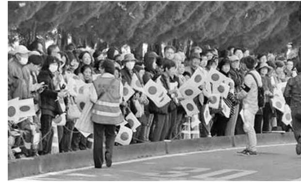
皇室の方々に奉迎するために日の丸小旗を配布

「祝日以外の慶事でも国旗を配布する機会があります。そこで、私たちが国旗を掲げる作業を通して、一人でも多くの日に国旗を掲げる様子を見れば、中には「自分でも掲げようか」と思ってくれるようになるのではないかと期待しています。国民の皆さんに、国旗に親