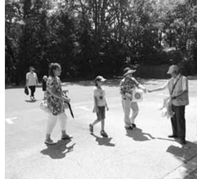
祝日以外の慶事でも国旗を配布

「祝日ごとに、自らの手で商店街のアーケードや街灯に国旗を掲げる作業や、たくさん日の丸小旗を作成して配布するなど、地道な作業を続けておられるのですね。」