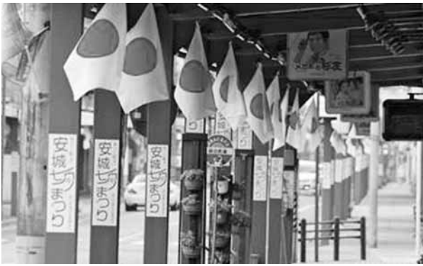
商店街のアーケードを国旗でいっぱい

「国旗掲揚推進愛知の会」とは、どのようなグループですか。私たちの活動は、平成二十一年、愛知県岡崎市から始まりました。今ではあまり見かけなくなつてしまつた「祝日の国旗掲揚」ですが、かつては当たり前のように日本中で行われていました。祝日に国旗を出して、お祝いは、祝日です。祝日は、宮中行事や地域の年中行事と深いつながりがあります。祝日を祝う心は、国や地域、郷土を大切に想うこと、その心を形として表すのが、国旗掲揚だと考えています。こうした習慣を残していきたい、