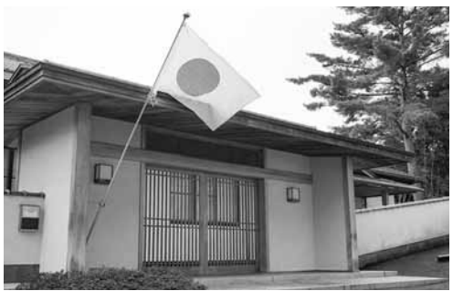
少なくなった祝日の各家庭での国旗掲揚

先月の「成人の日」の朝、玄関に国旗を掲げようと準備をしていたところ、小学生の息子が「よその家は国旗を出さないのに、なんでわが家は国旗を出すの？」と尋ねてきた。そこで「成人の日という祝日だから、日本の国旗を掲げてお祝い