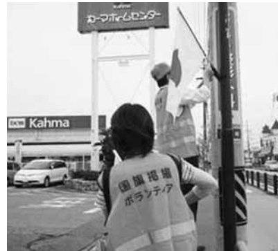
街灯に国旗を掲揚する会員

「祝日ごとに、自らの手で商店街のアーケードや街灯に国旗を掲げる作業や、たくさん日の丸小旗を作成して配布するなど、地道な作業を続けておられるのですね。」